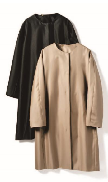
エアシルク・フォルムコート/¥130,000(税抜)