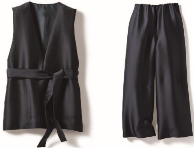
右：オクタダブルクロス・ワイドパンツ/¥33,000(税抜) 左：オクタダブルクロス・立体ジレ/¥43,000(税抜)