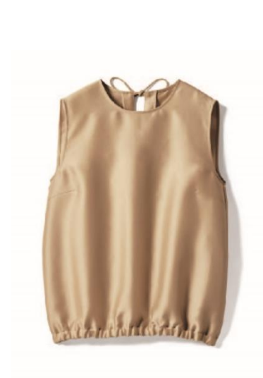
左：オクタダブルクロス・バックリボンブラウス/¥32,000(税抜)