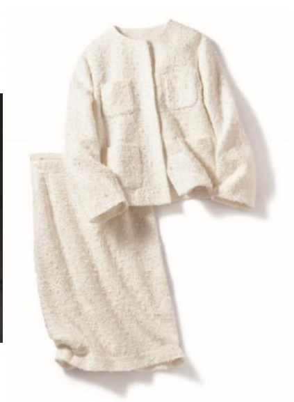
右：スラブ綿ツイード・ノーカラージャケット/¥72,000(税抜) 左：スラブ綿ツイード・スカート/¥38,000(税抜)